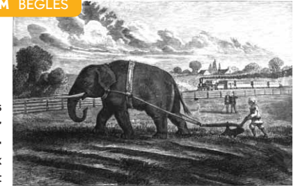
BARRON'S ELEPHANT PLOWING IN 1856.

Qui est le plus vieux ami de l'Homme ? Où sont apparus les premiers chiens, chevaux, moutons, chèvres et cochons domestiques ? Et pour quelles raisons les a-t-on domestiqués ? Des découvertes archéologiques et des études génétiques récentes permettent de mieux connaître l'histoire de ces animaux qui nous accompagnent ou dont nous dépendons.