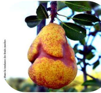
Dans la couleur des fruits mûres

Cette diversité propose aussi des écosystèmes résilients ainsi qu'une richesse de paysages et de savoir-faire associés très variés.