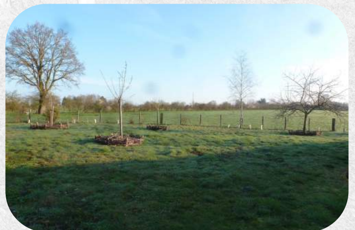
Plantation verger - Lycée des Sicaudières Bressuire - mars 2017

Cette forme de paysage arboré, loin d'être un espace historique fini, propose bien au contraire des solutions évidentes aux enjeux culturels, paysagers de nos communes et est une pierre précieuse à l'édifice de la lutte contre le réchauffement climatique et l'effondrement de la biodiversité.