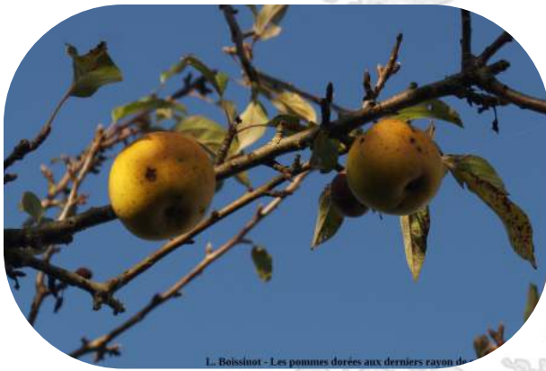
L. Boissinot - Les pommes dorées aux derniers rayons de