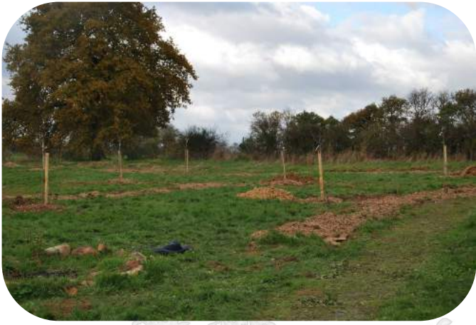
Plantation verger - La Sepaye Argentonnay - novembre 2013