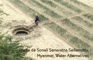
Myanmar, Water Alternatives

Judi 21 janvier 2021 : À LA MAISON ÉCOCITOYENNE BORDEAUX