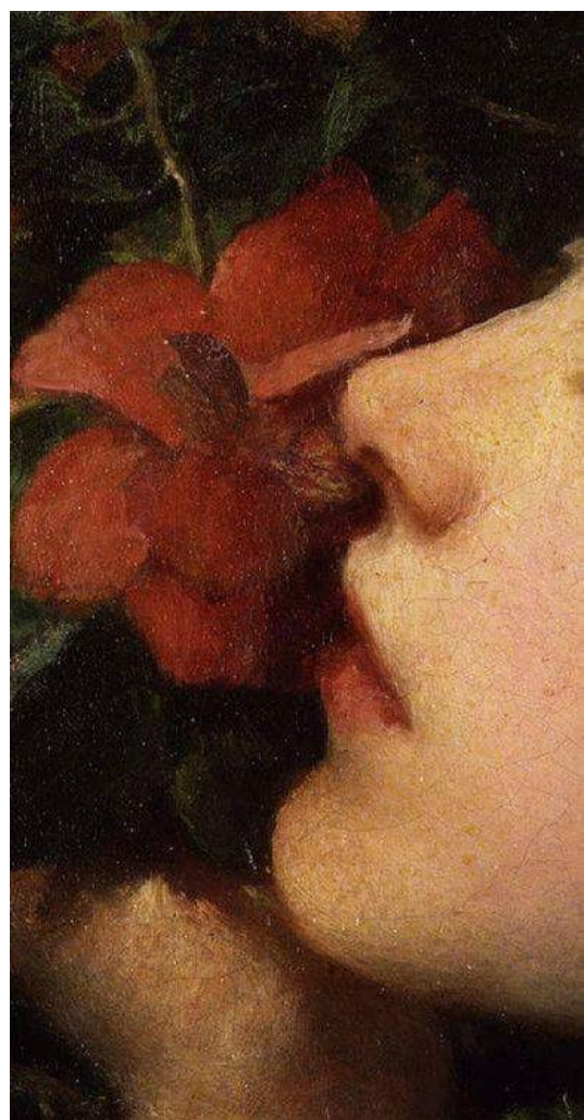
George Frederic Watts (1864) Dame Alice Ellen Terry 'Choosing'

Notre sens de l'olfaction une fois redécouvert, il pourra devenir notre allié, ami, protecteur et gardien de notre mémoire tout au long de notre vie. Pour peu qu'on en prenne soin. L'atelier « L'Odeur de la sagesse » est ainsi une parenthèse d'éveil et de sensibilisation pour apprendre à protéger et à développer notre odorat.