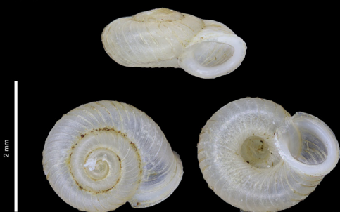
Vallonia costata 2,11 mm Creysse (Lot 46)