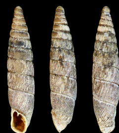
Succinea bidentata abietina 11,4 mm Cinca, Espagne

Possibilité de compléter ces animations avec un atelier naturaliste