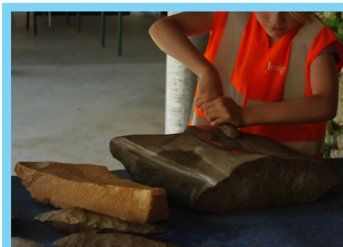
Découverte des haches polies et du Néolithique