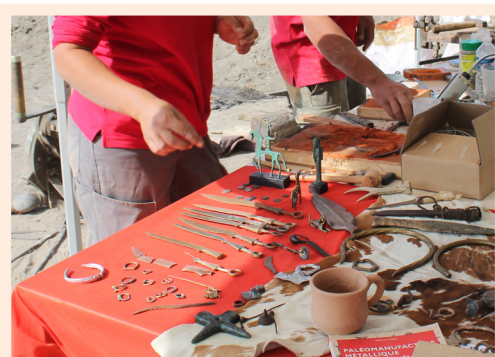
Atelier métallurgie lors des Journées Européennes d'Archéologie de 2019

Jeu de plateau qui permet aux participants de se familiariser avec les modes de vie du Néolithique : habiter, construire, élever, cultiver. Séances à 10h, 11h, 12h, 14h, 15h, 16h. CD24