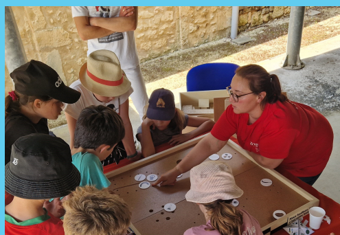
Atelier "Vous avez dit archéologie préventive" lors des Journées européennes de l'archéologie 2023

Découvrez les techniques de construction du Paléolithique et du Néolithique en participant à la fabrication des murs en torchis d'une habitation.