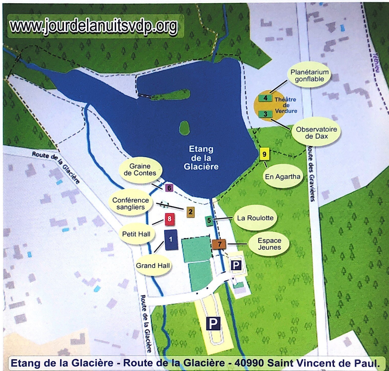
Etang de la Glacière - Route de la Glacière - 40990 Saint Vincent de Paul.