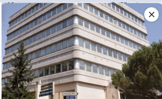
IBGC UMR 5095, Institut de Biochimie et Génétique Cellulaires