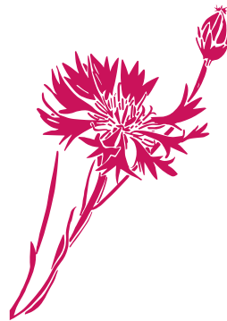
Bleuet des moissons Cyanus segetum