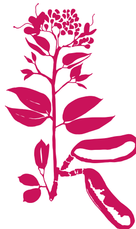
Courbaril Hymenaea courbaril