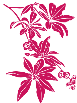
Benjoin Terminalia bentzoe