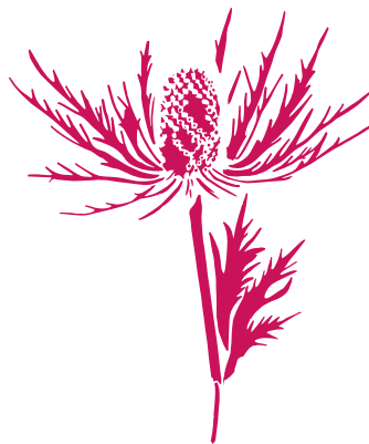
Le Chardon bleu Eryngium alpinum