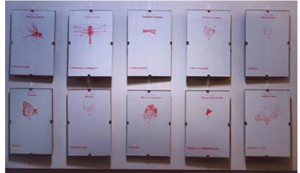
Étape 1 : poèmes et dessins exposés dans un ou plusieurs lieux choisis par chaque CBN

Cette performance s'appuie sur une expérience passée de l'artiste à propos d'insectes en voie de disparition. Pour cette oeuvre envisagée avec les CBN, les pochoirs représenteront des silhouettes végétales et seront graphés à l'aide d'une peinture écologique.