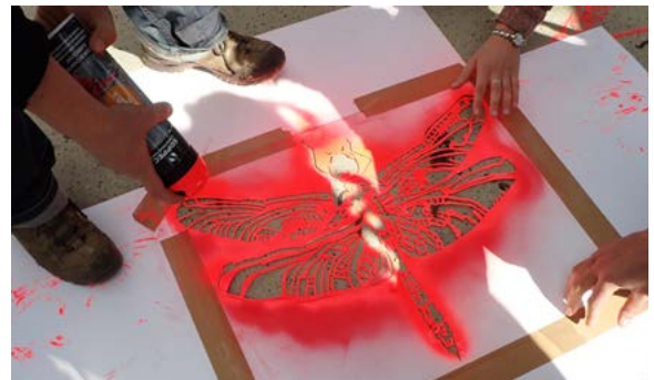
Étape 2 : chaque CBN mobilise les publics pour taguer la silhouette de la plante choisie sur son territoire, du lieu d'exposition vers un espace de plus en plus éloigné...