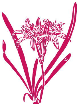
Lis des sables Pancratium maritimum