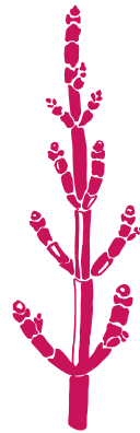
Salicorne d'Europe Salicornia europaea