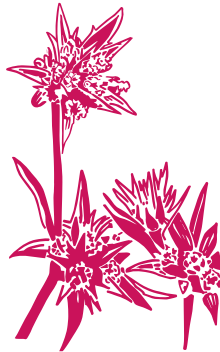
Panicaut vivipare Eryngium viviparum