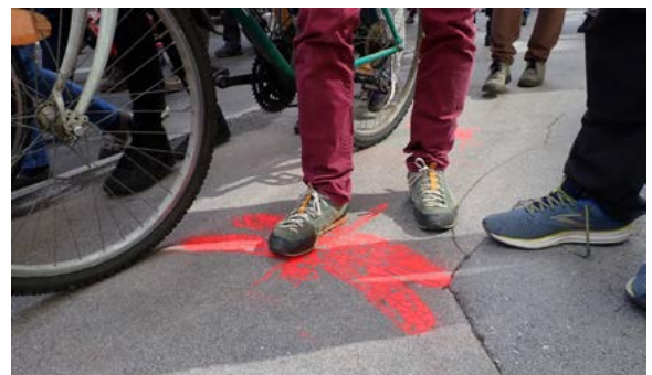
Étape 4 : le passage répété du public sur les silhouettes taguées au sol amplifiera la portée du message envoyé par les CBN