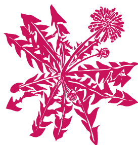
Pissenlit Taraxacum sp.