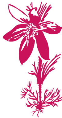
Anémone pulsatile Pulsatilla vulgaris