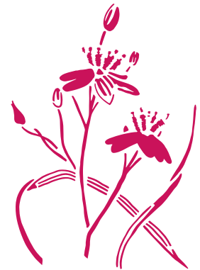
Siméthide à feuilles planes Simethis mattiazii