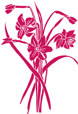
Narcisse des poètes Narcissus poeticus