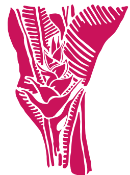
Le Balizyé Heliconia caribaea