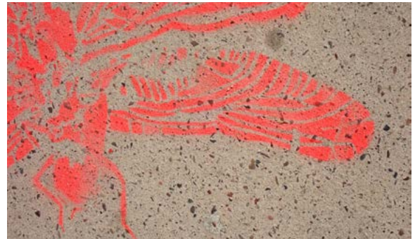
Étape 3 : les silhouettes interpelleront le public invité à se renseigner sur l'origine de ces dessins et leur signification (réseaux sociaux, web) tandis que des animations sont proposées pour approfondir les messages véhiculés par les CBN